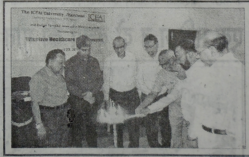
कार्यक्रम का उद्घाटन करते विशिष्टजना